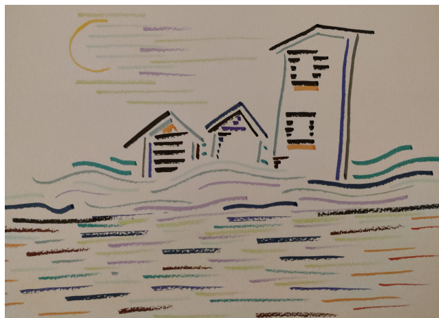
Le Jardin d'Éden (détail)

Sur les champs non-ensemencés allaient croître les récoltes. Tous maux allaient être réparés. La Science des Hommes allait enfin pouvoir briller. Les fidèles troupes, enfin libérées et protégées, allaient habiter ces lieux qui leur étaient, dès l'origine, promis et, pour l'éternité, jouir du bonheur.