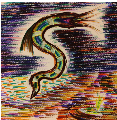
Fenrir dans le Marais des Têtes-Sanglantes (détail)

Un loup, pas celui que nous attendions puisque c'était un loup de mer, dévora le Soleil et jeta le malheur sur les Hommes. Ce loup s'empara de la Lune et provoqua un immense dommage. Les étoiles disparurent du Ciel. La Terre toute entière se mit à trembler, de même que les montagnes, à tel point que des arbres furent déracinés, des montagnes se sont écroulées, des chaînes et des liens furent rompus.