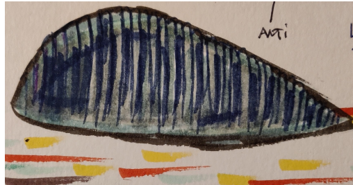
L'Avorton de Fenrir (Détail)

Fenrir abandonna un avorton de son engeance.