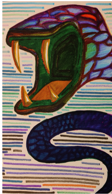
Le Serpent de Midgard (Détail)

Alors tous les dieux montèrent sur les sièges du jugement, divinités suprêmes, et se consultèrent.